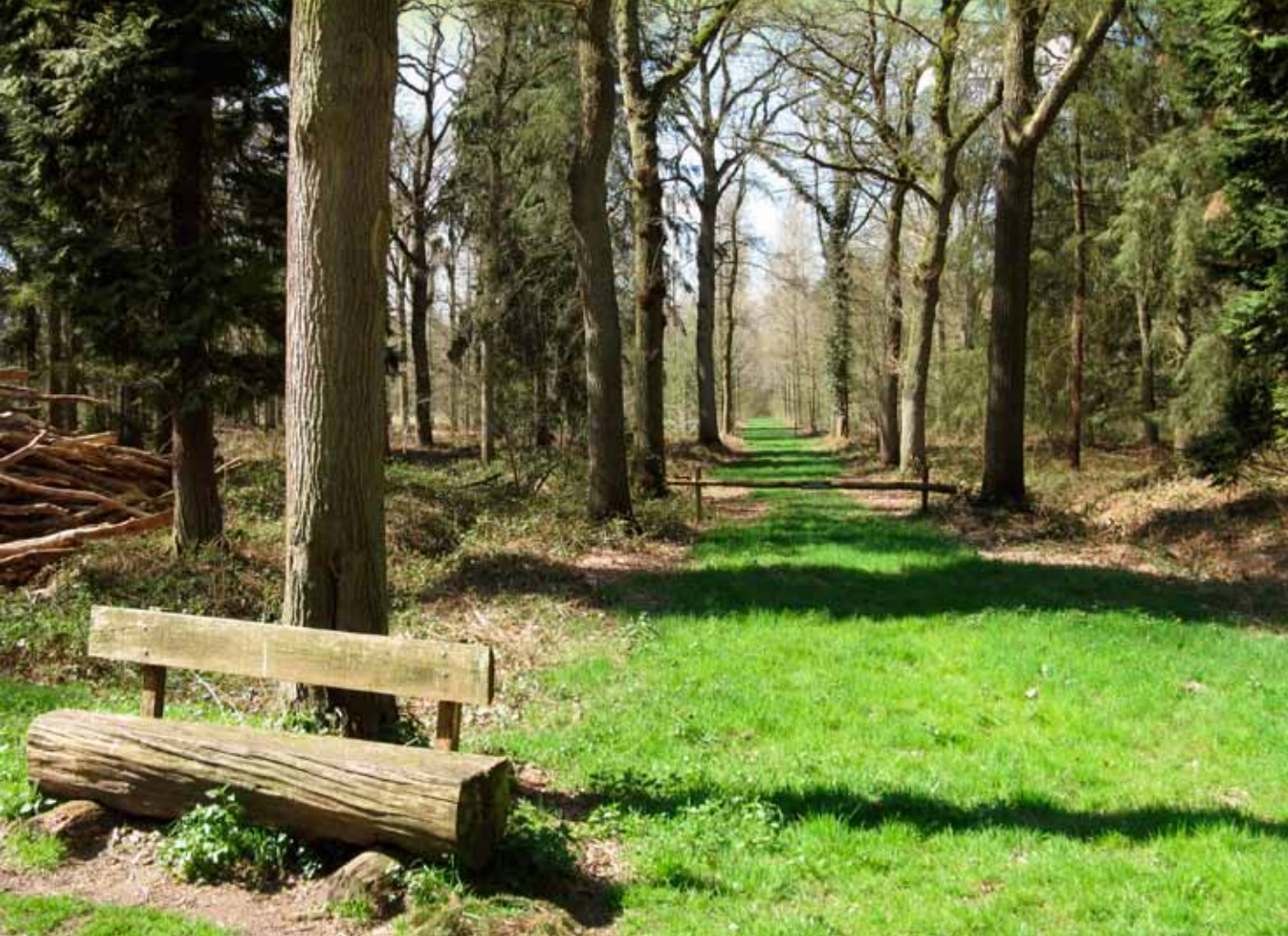
Multifunctioneel bos (hout, jacht en recreatie) op Landgoed Velder, dat ook beschikt over een evenemententerrein en cultuurgrond.