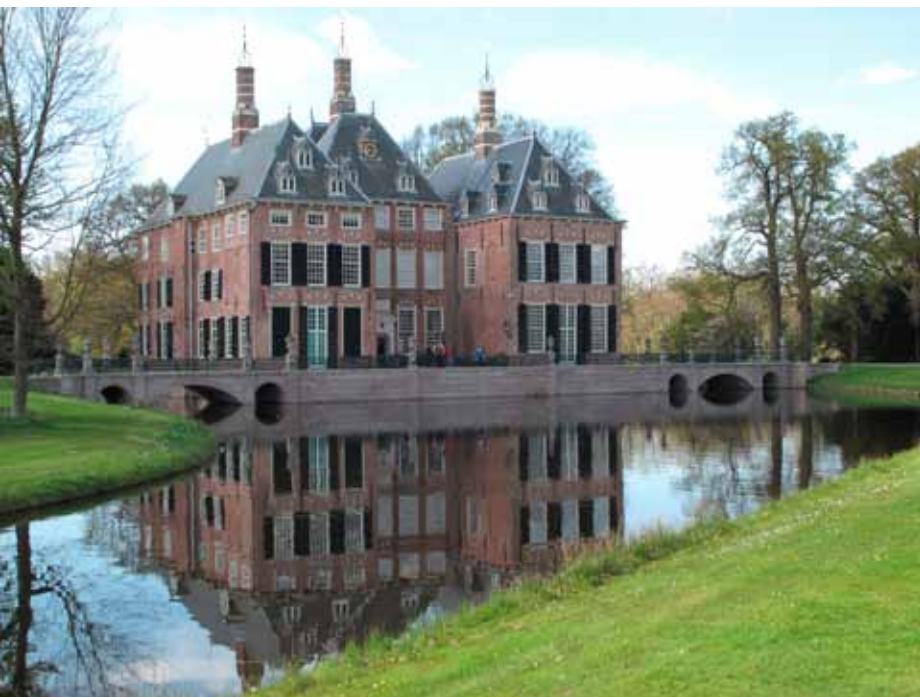
Links: Kasteel Duivenvoorde; cultureel erfgoed dat mede in stand kan worden gehouden dankzij de agrarische bedrijven op het bijbehorende landgoed.